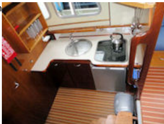
Doerak LX 1000 SalonDoerak LX