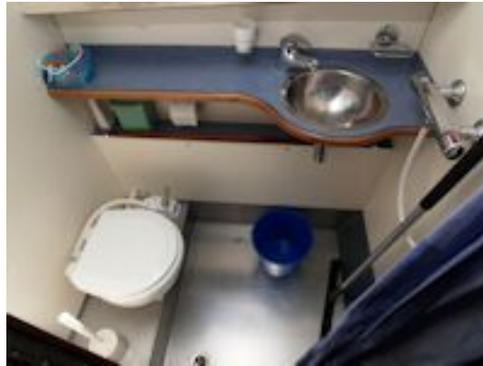
Doerak LX 1000 Salon Doerak LX