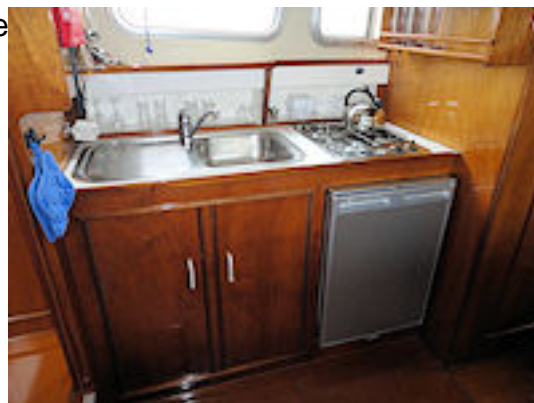
Doerak LX 910 AK