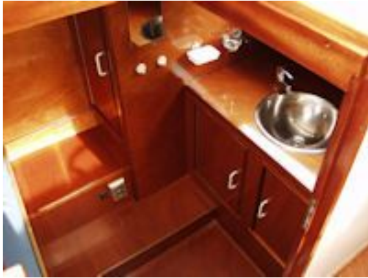
Doerak LX 911 AK Salon Doerak LX911 AK Douche- Doerak LX911 AK Toilet